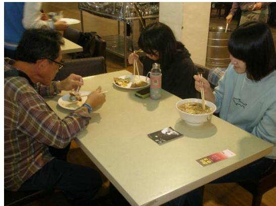
Non-disposable Tableware in the Student Restaurant