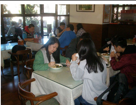
The Restaurant located in Engineering College (Outsourced) Provides Non-disposable Tableware Service