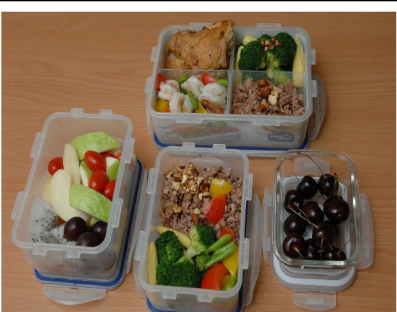
Outsource Supplier and Subcontractors Provide Reusable Tableware