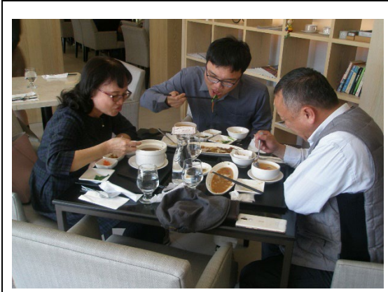
The Restaurant located in Design College (Outsourced) Provides Non-disposable Tableware