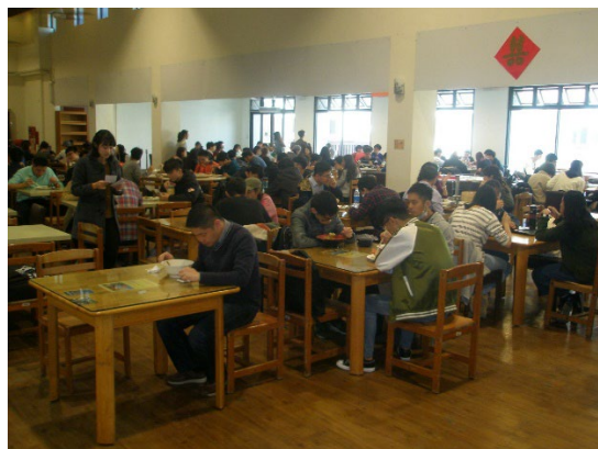
Non-disposable Tableware in the Student Restaurant