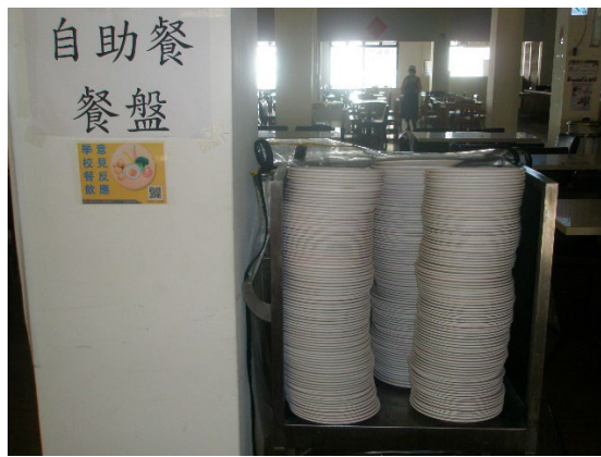
Student Restaurant (Outsourced) Provides Non-disposable Tableware Service