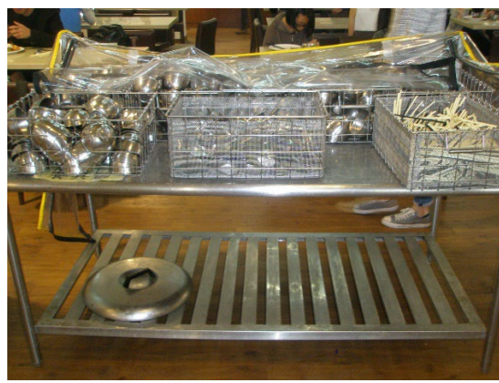
Student Restaurant (Outsourced) Provides Non-disposable Tableware Service